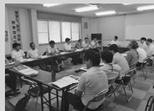
バスフェスタ実行委員会の様子

なお、本事業は、平成30年度政策提言委員会が鳥取市に提言したことが実現したものととなります。当日はお子さま連れの皆さまにも楽しんでいただける催しを予定しております。是非会場にお越しください!