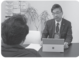
インタビューの様子

このインタビューの完全版は鳥取YEGのホームページに掲載されています。 http://www.t-yeg.jp/ インタビュー・構成 総務広報委員会