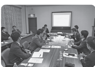
宮津YEGとの山陰近畿道について意見交換会の様子