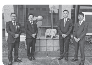
視察に参加した委員

また、商工会議所青年部発祥の地でもある宮津YEGの皆さまとは、山陰近畿道開通を見据え、連携・交流を深め、早期開通への気運を高めました。日本有数の観光資源がある両市が繋がることで、地域間交流、人流、物流、産業の活発化による地域経済の発展が期待されます。今後、委員会内で協議を重ね、今年度も地域のために提言書を提出したいと考えております。